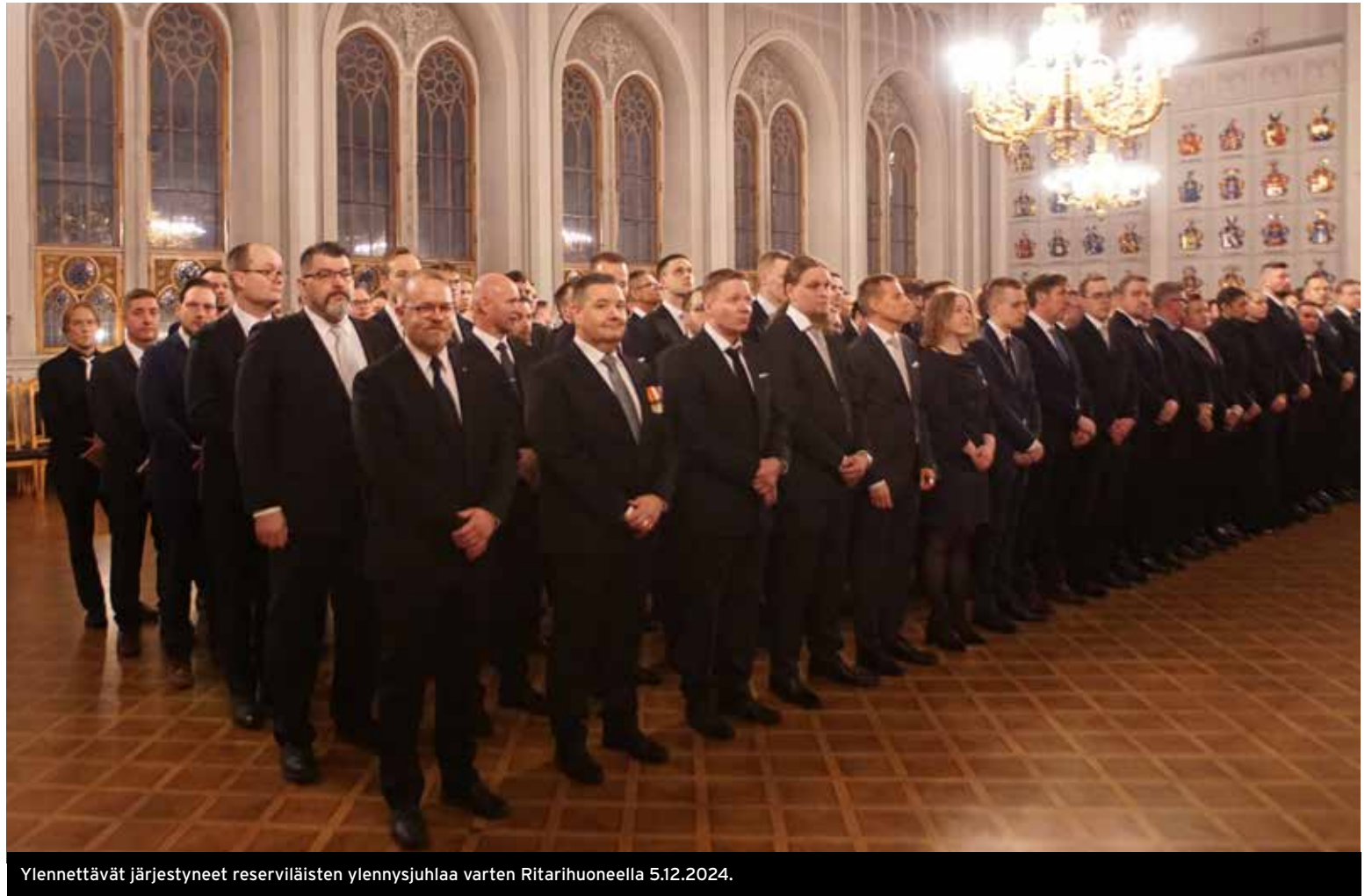
Ylennettävät järjestyneet reserviläisten ylennysjuhlaa varten Ritarihuoneella 5.12.2024.

Puolustusministeri Antti Häkkänen on myöntänyt Reserviläisliiton ansioristin ansiosta vapaaehtoisessa