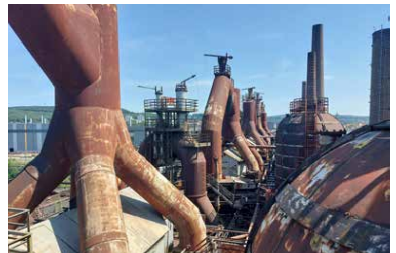
Unescon maailmanperintökohde, Völklingen terästehdas oli valtava.