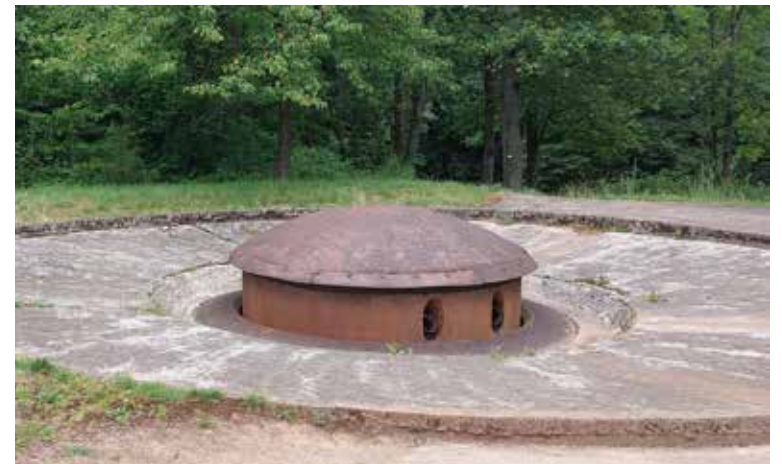
Tykki nousemassa maan alta esiin ammutta varten Maginot linjalla Hackenbergin linnoituksessa.