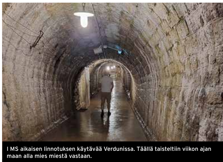
I MS aikaisen linnoituksen käytävää Verdunissa. Täällä taisteltiin viikon ajan maan alla mies miestä vastaan.

Matkalla Saksan puolelle poikkesimme 1300-luvulta olevalle Teufelsburgin rauniolinnalle. Sen laelta avautui näkymä Saarin jokilaaksoon.