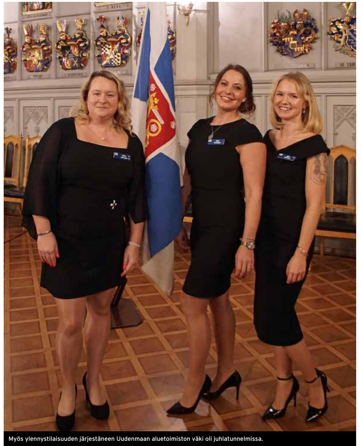
Myös ylennystilaisuuden järjestäneen Uudenmaan aluetoimiston väki oli juhlatunnelmissa.

Helsingin Reservin Sanomat onnittelee kaikkia ylennettyjä ja palkittuja!