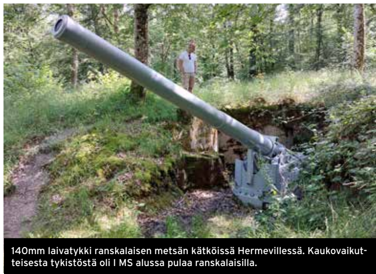
140mm laivatykki ranskalaisen metsän kätköissä Hermevillissä. Kaukovaikutteisesta tykistöstä oli I MS alussa pulaa ranskalaisilla.