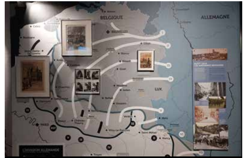
Saksan hyökkäys Ranskaan 1914 koottuna kuvassa.

Päivän toinen pääkohde oli Hackenbergin linnoitus osana Maginot-linjaa. "Hirviö" oli tämän nimi, koska se oli kaikista suurin. 10 km maanalaisia käytäviä, joissa miehistöä kuljetettiin sähköjunalla tuliaseisiin, jonne oli majoituksesta n.1.5 km matka. Tämä juna (jolla pääsimme itsekkin matkaamaan) ja yksi tykeistä nosto- ja pyörityskoneistoinen oli edelleen käyttökunnossa ja mm. nämä meille esiteltiin lähes 3 h opastetulla kierroksella. 1200 miestä olisi kyennyt täällä olemaan eristyksissä 3 kk ajan. Sähköt paikkaan tuotettiin alkuperäisillä dieselkoneilla. Vahva suositus käydä!