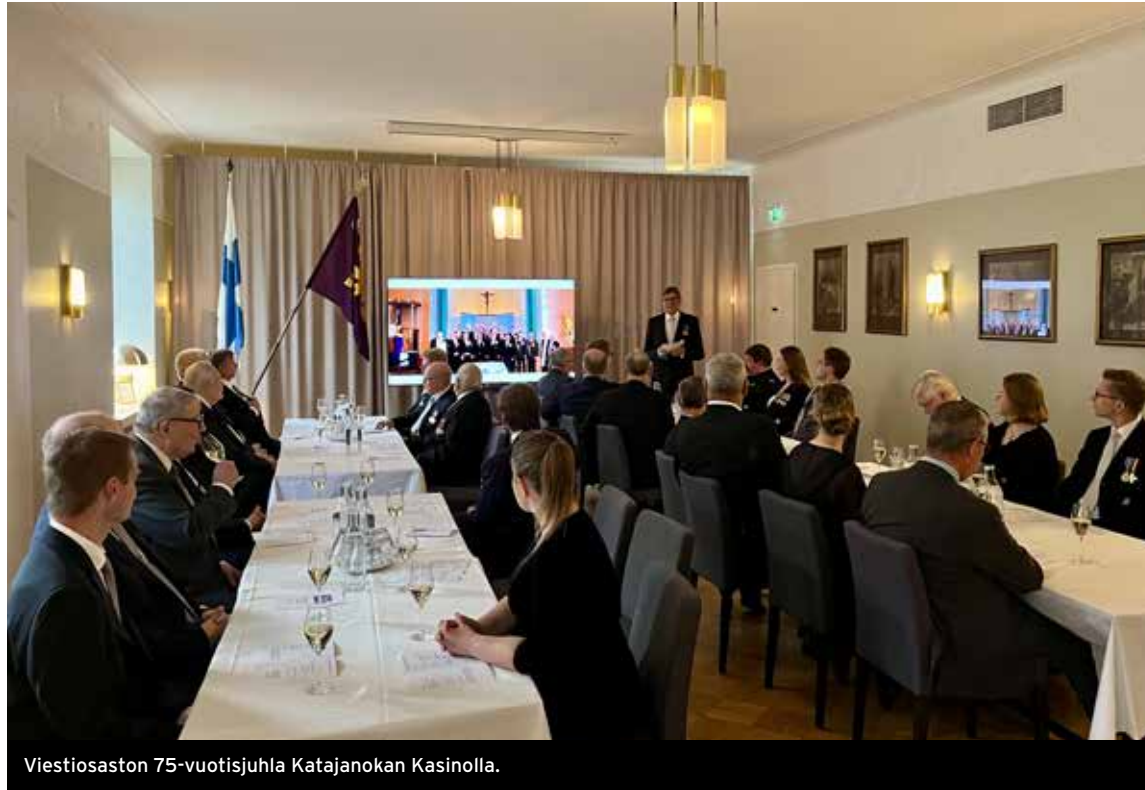
Viestiosaston 75-vuotisjuhla Katajanokan Kasinolla.

Sittemmin Viestiosaston toiminnan muodot ovat pysyneet pitkälti muuttumattomina ja pääpaino on ollut viestikoulutuksessa, ammunnessa, liikunnassa ja esitelmissä. Suurin muutos on koettu kyberturvallisuuden alalla, joka on noussut viestikoulutuksessa merkittävään rooliin.