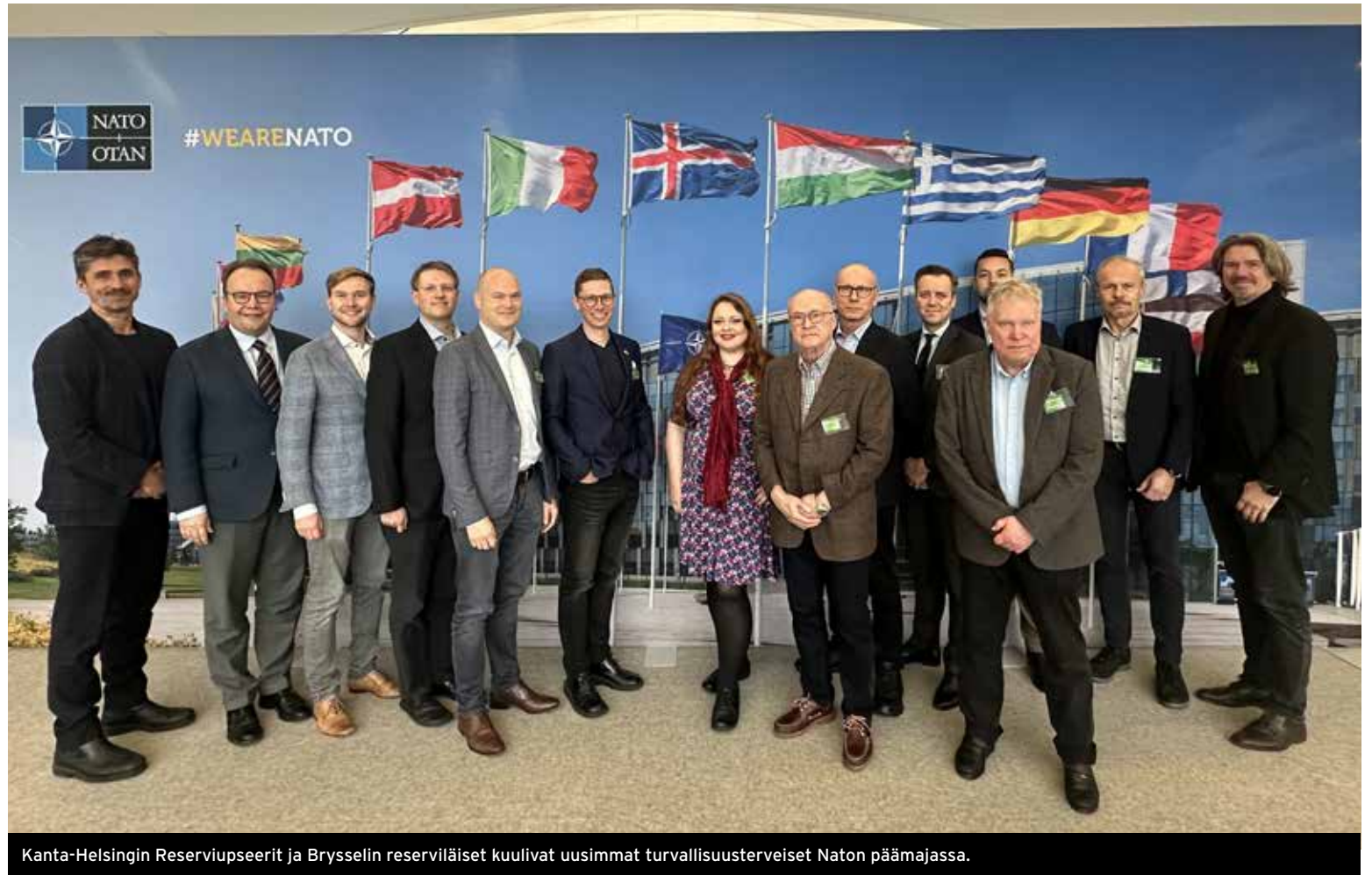
Kanta-Helsingin Reserviupseerit ja Brysselin reserviläiset kuulivat uusimmat turvallisuusterveiset Naton päämajassa.

Tanskalaisen upseerin mukaan suomalaisten reserviläisten kannattaa hakea Naton sotilastehtäviin, jos suinkin kiinnostaa. Kunnan osaaminen on kohdillaan, ei