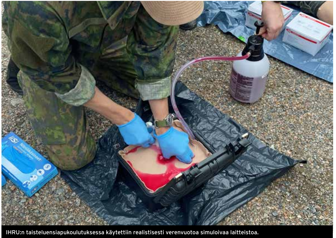
IHRU:n taisteluensiavukoulutuksessa käytettiin realistisesti verenvuotoa simuloivaa laitteistoa.

IHRU:n tarkoituksena on tehdä ensiapukoulutuksesta säännöllinen osa kerhon toimintaa ja järjestää lisää taisteluensiavukoulutusta jäsenistölle myös jatkossa.