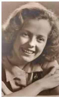
MARJATTA JOKISEN ARKISTO

”6. helmikuuta oli kaunis talvi-ilta ja päätin lähteä luistelemaan Brahen kentälle Kallion kaupunginosaan. Olin päässyt juuri vauhtiin, kun taivaalle ilmestyi valopommeja. Oli valoisa kuin aurinkoisena kesäpäivänä, mutta hälytys sireenit soivat. Kaikki ryntäsivät pukukoppiin hakemaan kenkiään. En kuitenkaan tiennyt, mihin mennä tai missä pommisuoja oli, joten juoksin luistimet jalassa toisten perään ja päädyin Kaarlenkadun kalliosuojaan. Pommisuoja oli täynnä eikä kaikille ollut istumapaikkaa. Sain kuitenkin vaihdettua kengät jalkaani. Yö kului suojoissa. Aamulla viiden aikaan tuli ”vaara ohi”-merkki ja pääsimme ulos. Menin raitiovaunupysäkille odottamaan, kunnes joku sanoi, etteivät raitiovaunut kulje. Minun täytyi lähteä kävellen kotimatkalle toiselle puolen kaupunkia. Kaupunki oli hiljainen