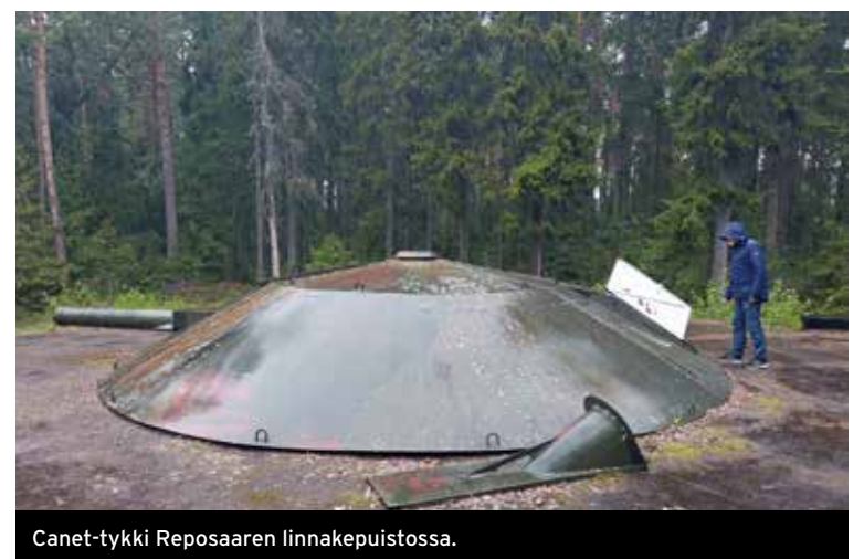
Canet-tykki Reposaaren linnakepuistossa.