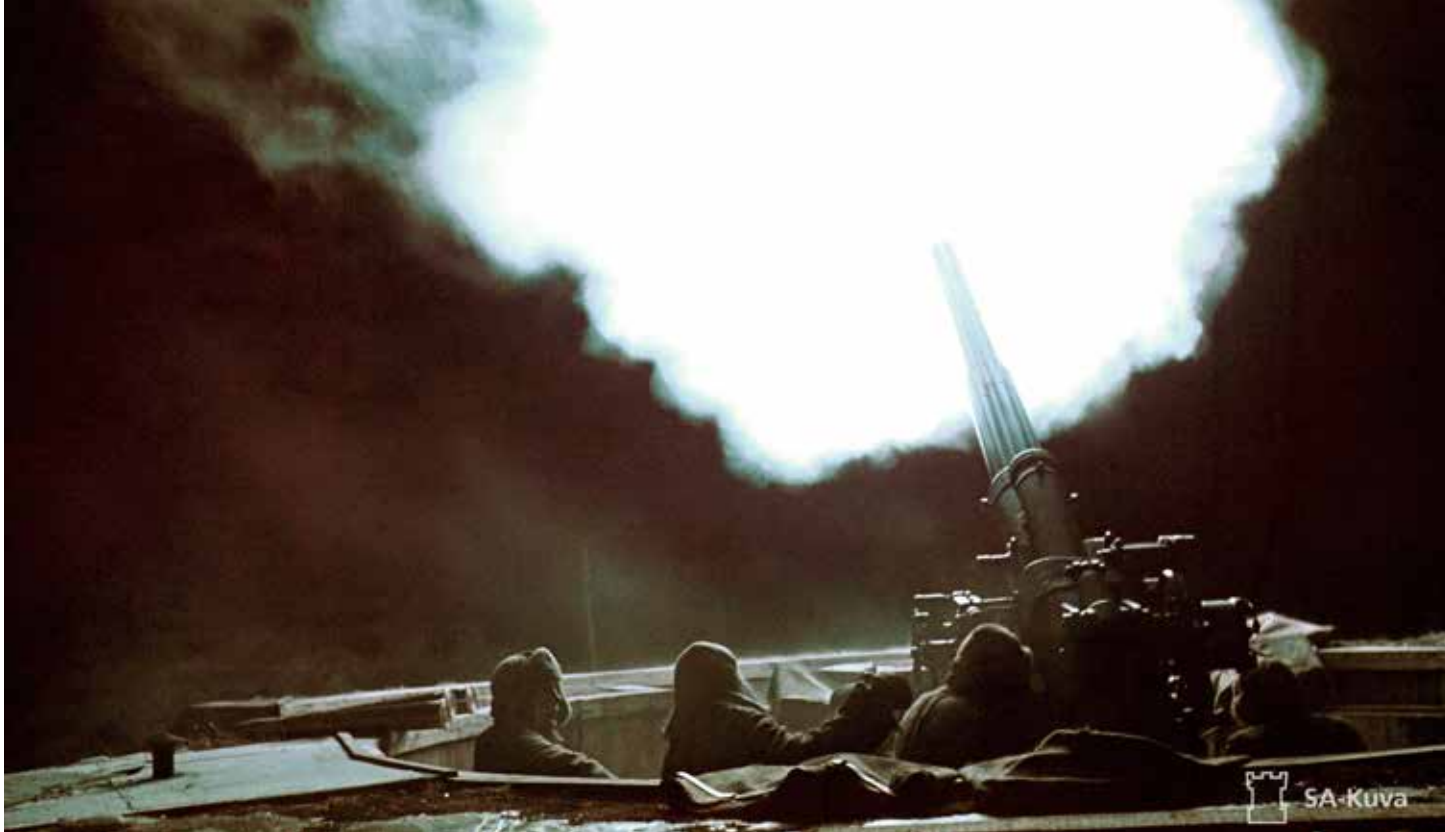
Raskas it-patteri ampuu Käpylän Taivaskalliolla.

80 vuotta Helsingin ilmapuolustuksen strategisesta torjuntavoitosta