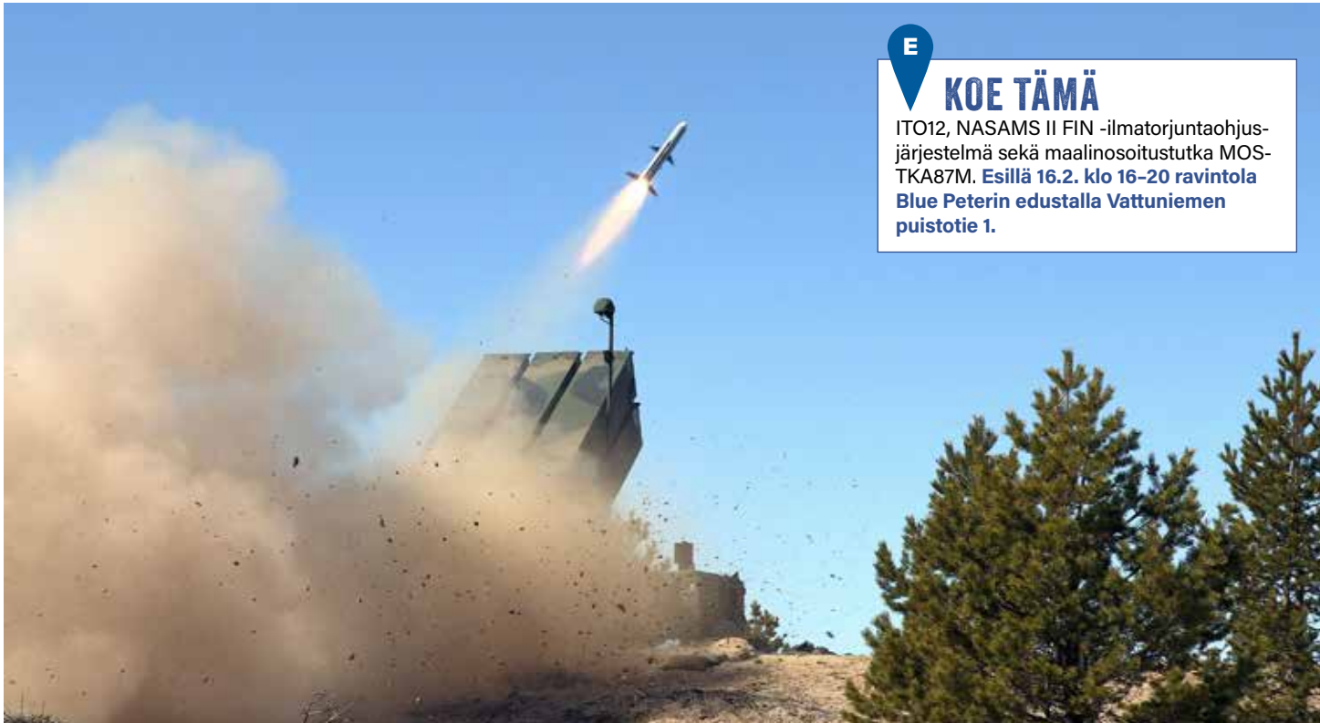
Tulta putkesta. Ilmatorjuntaohjusjärjestelmä NASAMS II FIN.