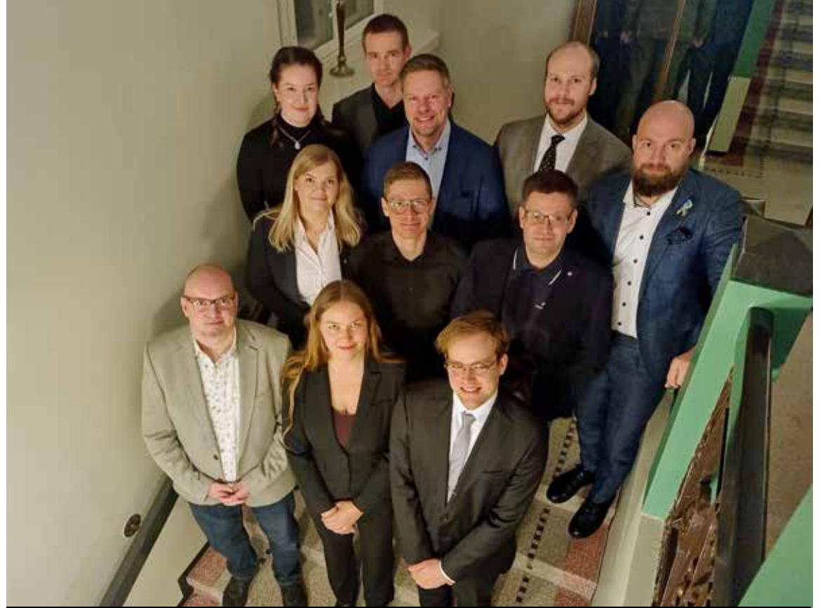
Helsingin Reserviupseeriin vastavalittu piirihallitus yhteiskuvassa.