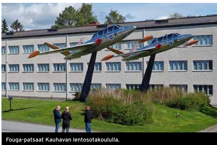
Fouga-patsaat Kauhavan lentosotakoululla.