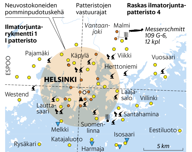
Ilmatorjuntarykmentti I patteristo, Ilmatorjuntarykmentti II patteristo, Raskas ilmatorjuntapatteristo 4, Raskas ilmatorjuntapatteristo 1