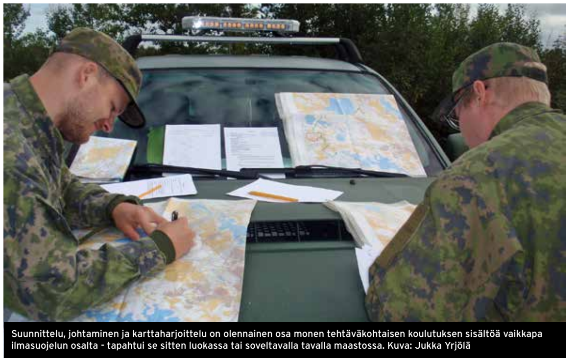
Suunnittelu, johtaminen ja karttatarjoittelu on olennainen osa monen tehtäväkohtaisen koulutuksen sisältöä vaikkapa ilmasuojelun osalta - tapahtui se sitten luokassa tai soveltavalla tavalla maastossa.