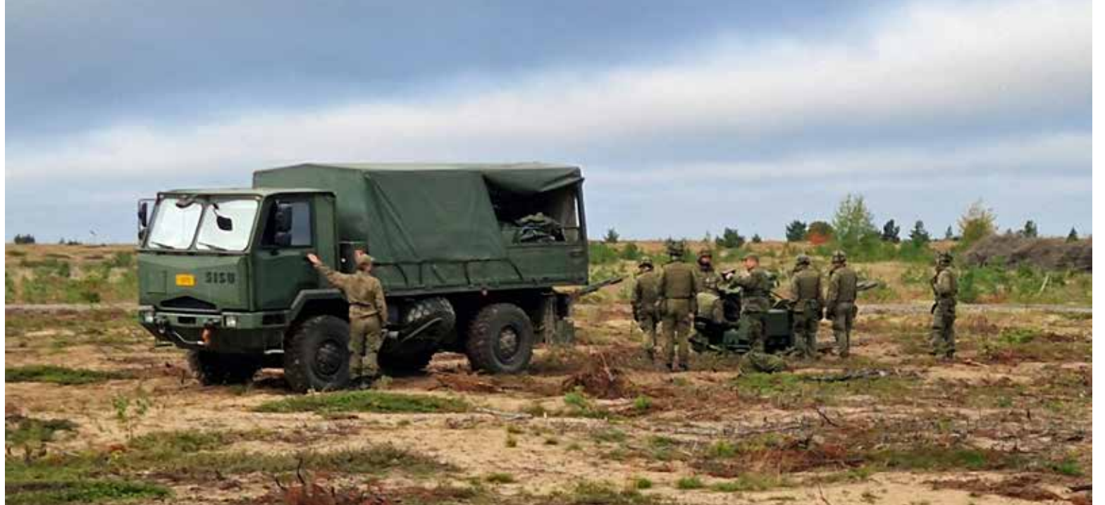
Asemaanajo sekä tykin ampumakuntoon valmistelu on olennainen osa myös 23ITK95-tykkiryhmän eri tehtävien koulutusta.

Koulutusohjelmaan kuuluvat kurssit jaotellaan neljään eri kategoriaan: sotilaallisten valmiuksien perus- ja jatkokursseiksi, kouluttajakoulutuskursseiksi tai tiedotus- ja valistuskursseiksi. Sisällöllisesti kurssikokonaisuuksia löytyy muun muassa ilmasuojeluun, 23ITK61-asejärjestelmään, 35ITK88-asejärjestelmäkoko- naisuuteen, ilmatorjunnan johtami- seen, tulenjohto- ja viestitoimintaan sekä päällikkönä toimimiseen. Koulutusohjelmasta löytyykin monipuolinen tarjonta kursseja erilaisiin ilma- torjunnan tehtäviin eri tasoilla. Osa