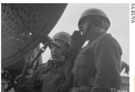
Venäläiset rynnäköivät Lauttasaaren eteläkärjessä sijainnutta johtopatteri ”Puistoa” vastaan kolmesti ensimmäisen pommitusyon aikana. Kuvassa patterin saksalainen tutka ”Irja”.

Lottahuone: Lottia ja Ilmatähystäjiä. Opastettu kierros 31.12.2024 asti. Olympiastadionin 8. krs. Liput: lippu.fi.