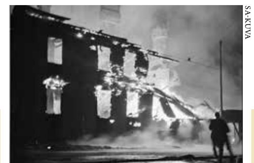
Porthaninkadulla palaa 17.2.1944.