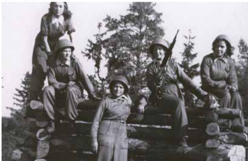
Valonheitinlotat asentavat kalustoa Helsingissä keväällä 1944. Lotat saivat uniformukseen sillehaalarit ja italialaista mallia olevat kypärät. Terni-kivääri on annettu lottille henkilökohtaisena puolustautumista varten.