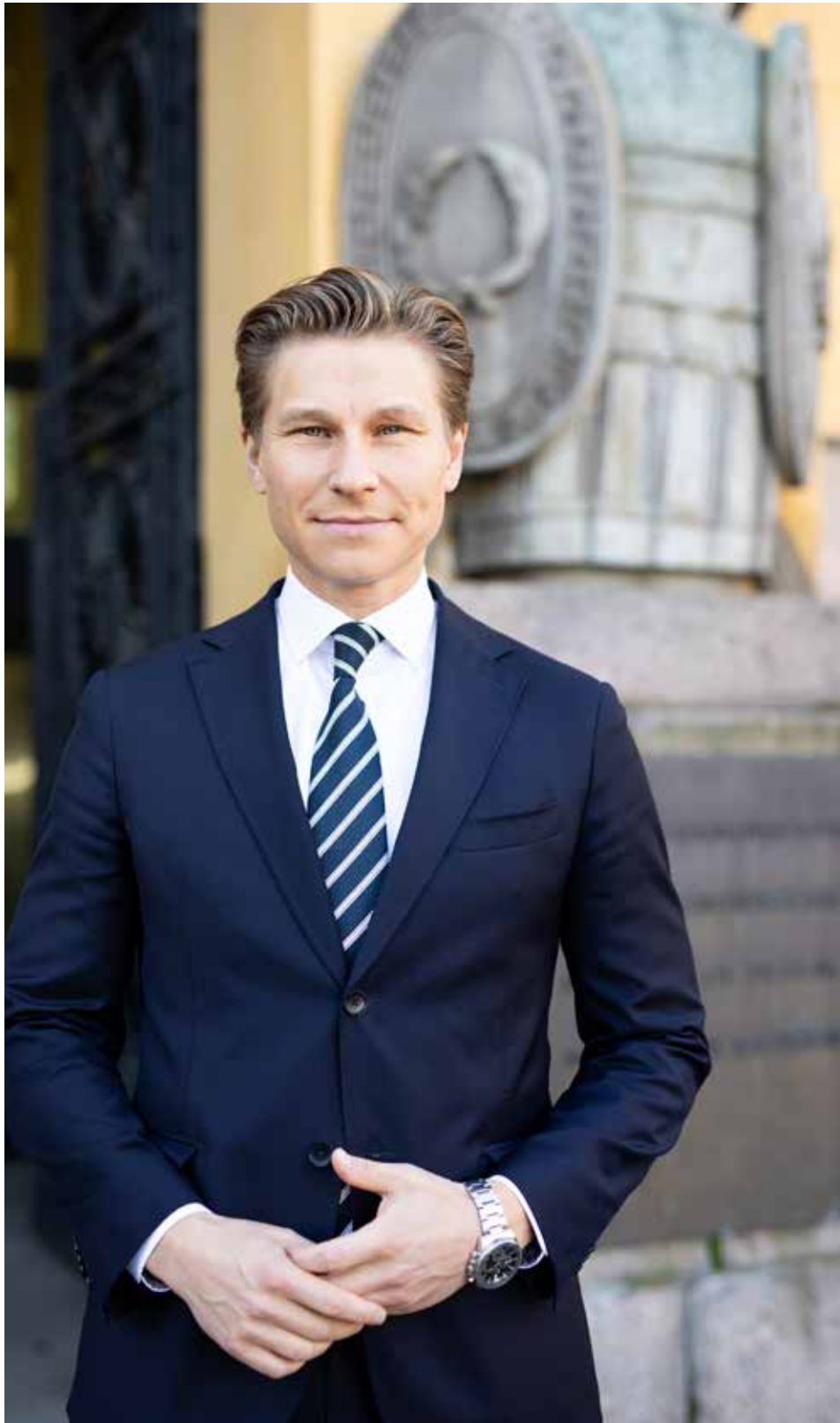
Puolustusministeri Antti Häkkänen ukki oli sotaveteraani ja mummi rintamalotta.

C KOE TÄMÄ Kaartin jääkärirykmentin ja Panssariprikaatin Helsingin ilmatorjuntarykmentin alokkaat vannovat sotilasvalan Senaattorilla 16.2. klo 9-15.