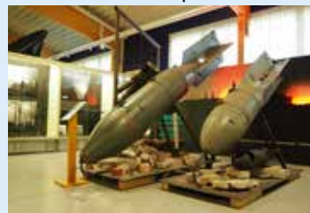
500 kilon neuvostopommi on esillä Sanomatalon Käytävägalleriassa.