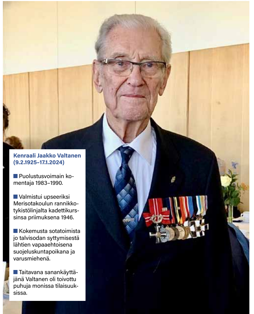
Kenraali Jaakko Valtanen (9.2.1925–17.1.2024)

Jaakko Valtanen oli viimeinen puolustusvoimien