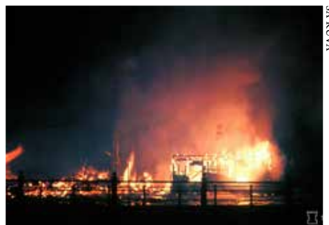
Helsingin keskustassa palaa 7.2.1944.

●●●● VIHOLLINEN MENETTÄÄ 13 POMMIKONETTA, JOISTA PUDOTUKSIA NELJÄ, KAKSI TEKEE PAKKOLASKUN JA SEITSEMÄN TUHOUTUU ONNETTOMUUKSISSA. ●●●● HELSINGIN SANOMAT 8. HELMIKUUTA: ”VÄESTÖN KESKUUDESSA EI ILMENNYT MINKÄÄNLAISTA HERMOSTUMISTA.”