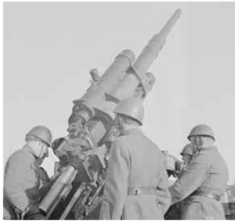
Santahaminan it-patteri helmikuussa 1944.