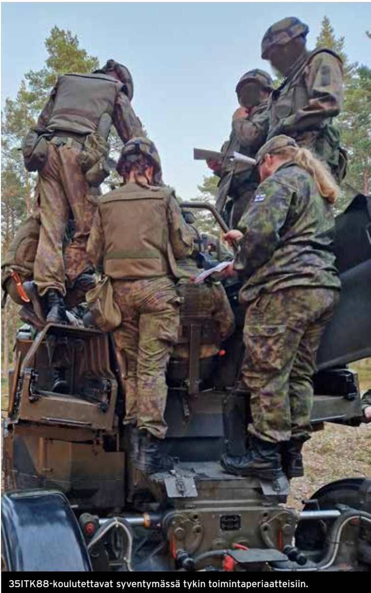
35ITK88-koulutettavat syventymässä tykin toimintaperiaatteisiin.

Kirjoittaja on Suomen Reserviupseeri- liiton koulutustoimikunnan puheen- johtaja sekä ilmatorjunnan koulutus- päällikkö MPK:ssa.