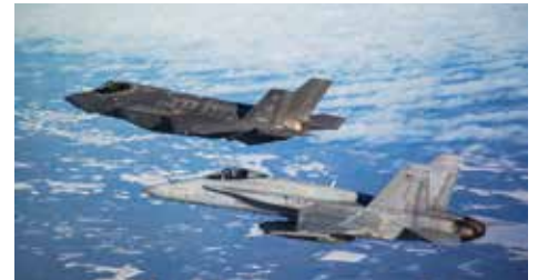
Lockheed Martin F-35 Lightning II on häivehävittäjä.

ITO12, NASAMS II FIN -ilmatorjuntaohjusjärjestelmä sekä maalinosoitustutka MOS-TKA87M. Esillä 16.2. klo 16–20 ravintola Blue Peterin edustalla Vattuniemen puistotie 1.