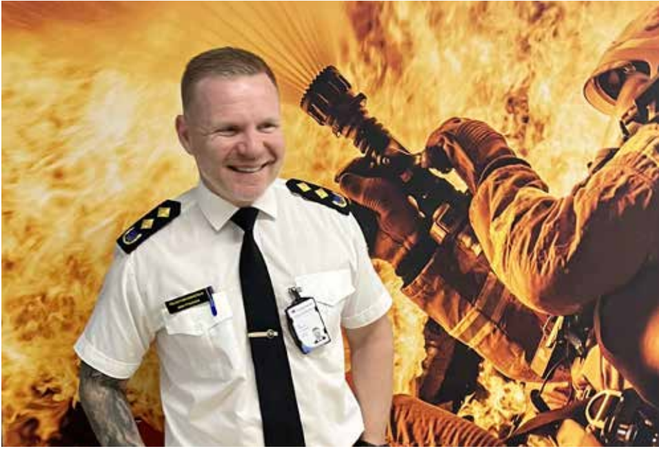
Pitkänen mukaan väestönsuojelu on Suomen lippulaivoja, mutta hälytysjärjestelmää ja suojien kuntoa pitää kohentaa.