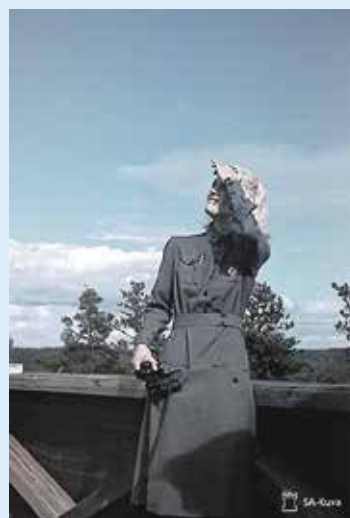
Lotilla oli merkittävä rooli ilmapuolustuksessa.

Ilmatorjuntamuseon näyttelyt ovat esillä Digimuseossa helmikuun alusta 2024 digimuseo.fi