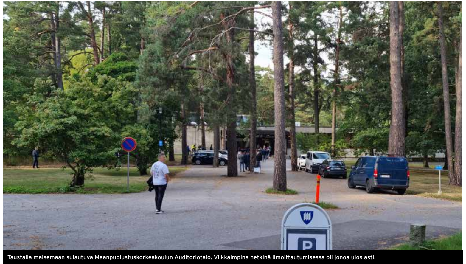
Taustalla maisemaan sulautuva Maanpuolustuskorkeakoulun Auditoriotalo. Vilkkaimpina hetkinä ilmoittautumisessa oli jonoa ulos asti.

Vapaaehtoisesta maanpuolustuskoulutuksesta lakisääteisesti vastaavan Maanpuolustuskoulutus MPK:n kurssit täyttivät äärimilleen. Monilla kursseilla tehtiin uusia osallistujajärjestäjiä. Kurseja pyrittiin järjestämään myös