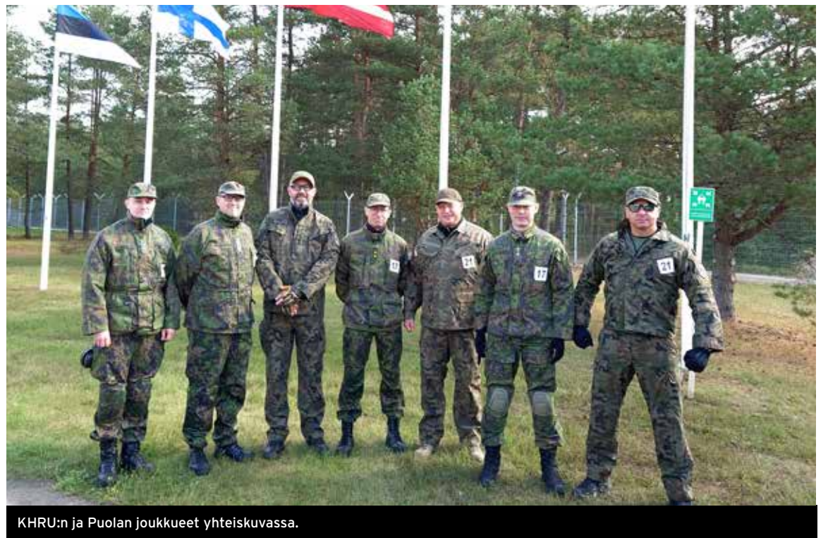
KHRU:n ja Puolan joukkueet yhteiskuvassa.

EROKin kisa on aina erinomaisesti järjestetty ja keskustelut muiden maiden reserviupseereiden kanssa ovat antoisia. Ensi vuonna uudestaan!