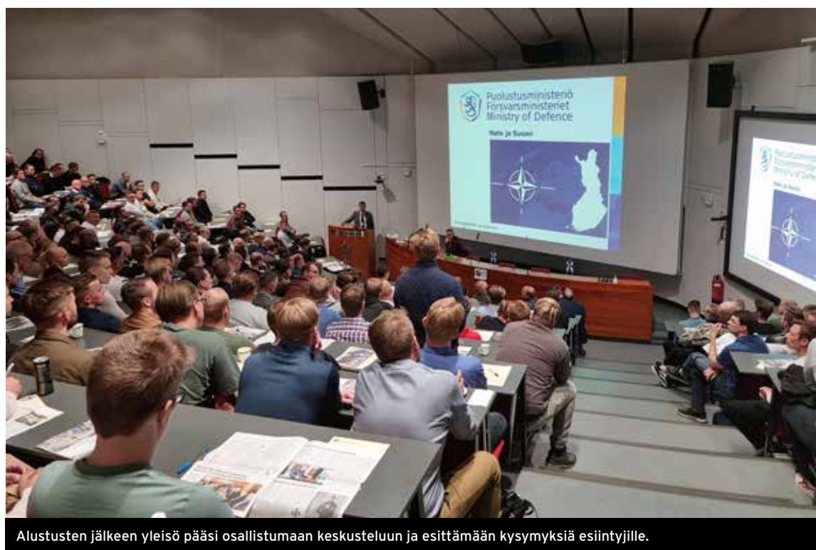
Alustusten jälkeen yleisö pääsi osallistumaan keskusteluun ja esittämään kysymyksiä esiintyjille.

Tapahtumien ilmoittautumislistoilla ehti pyörähtää ja MPK:n koulutuskalenteria käyttäen lähes tuhat reserviläistä. Päivien lopullisilla nimilistoilla heitä oli hieman alle 900. Syysflunssat ja lasten päiväkotipöpot karsivat osanottajajoukkoa vielä viime hetkillä, mutta käytössämme olleiden salien täyttöaste pysyi silti turvallisesti 90% yläpuolella.