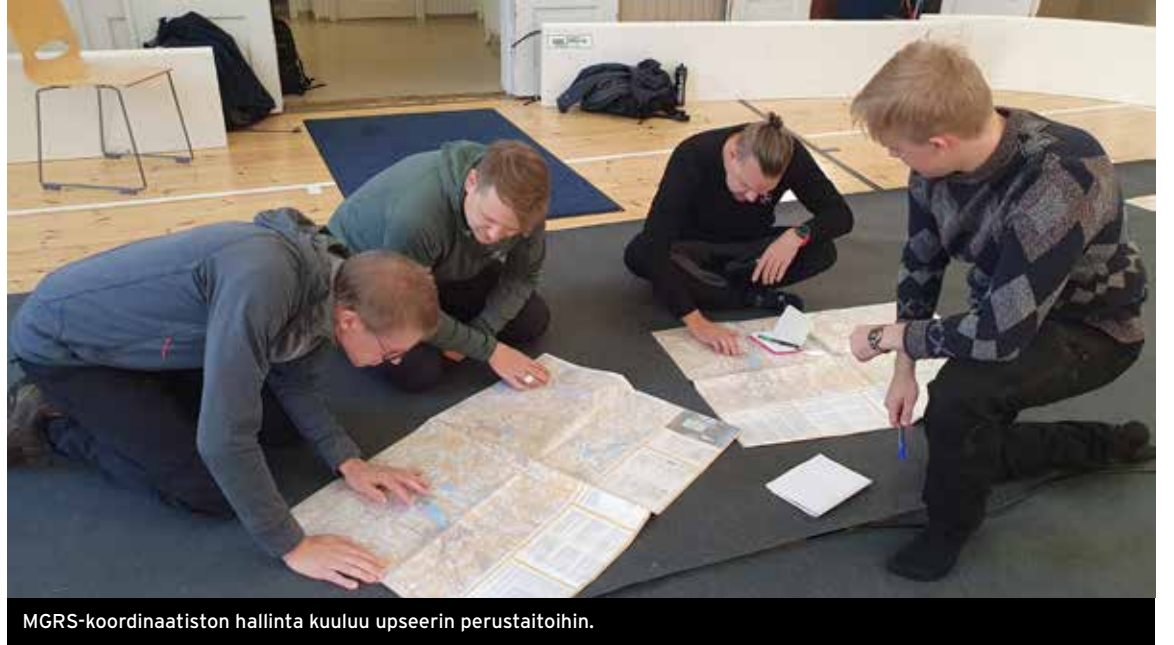
MGRS-koordinaation hallinta kuuluu upseerin perustaitoihin.