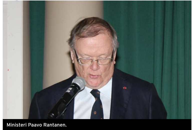
Ministeri Paavo Rantanen.