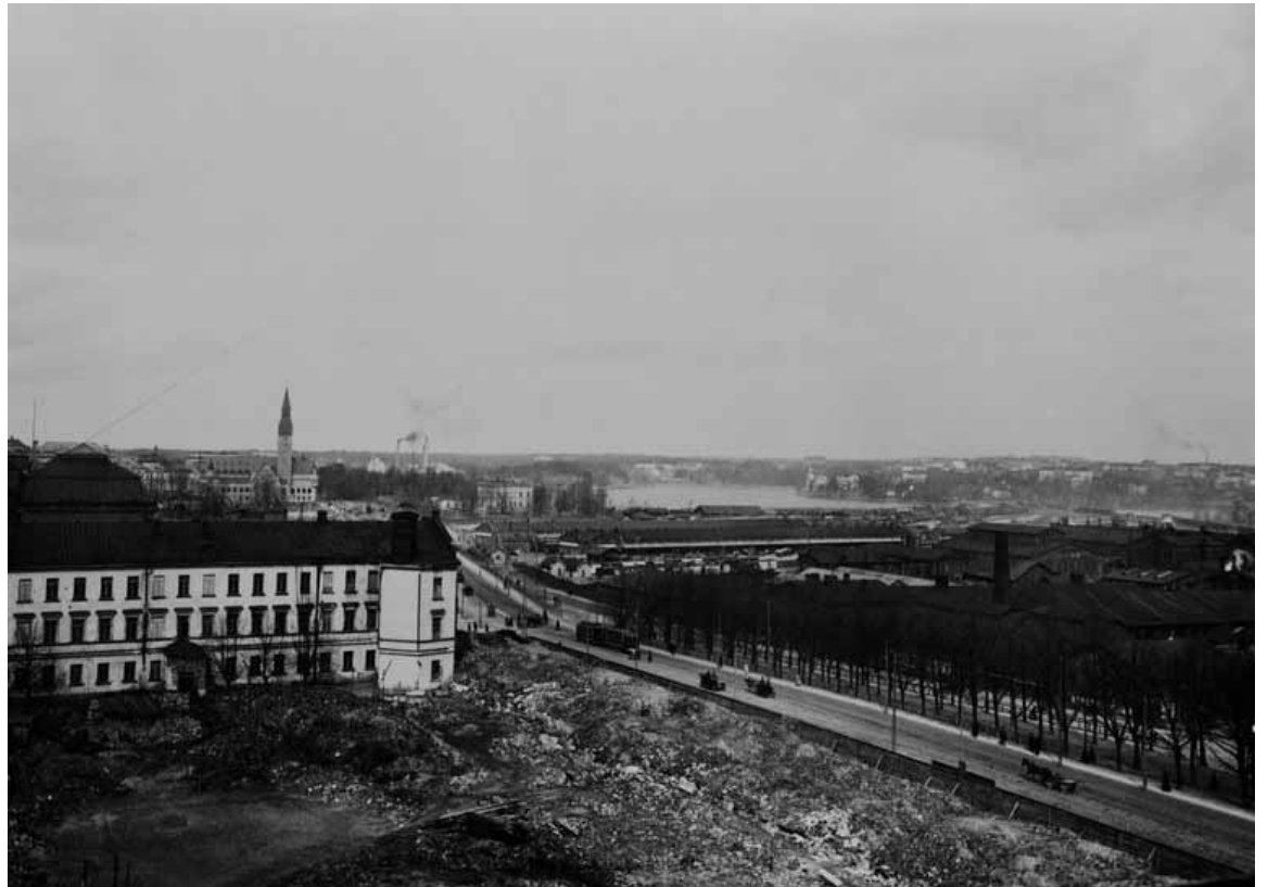
Purettu päärakennus ja Salomonkadun osa on jäljellä.

Sotien välisenä aikana ehkä leimaa antavaa oli kasarmialueella olevien huollon joukkojen suuri määrä. Siellä toimivat vuoteen 1935 asti ainakin Helsingin varuskunnan sairastalli ja Aseseppäkoulu. Hevosten ohella autot ja moottoripyörät liittyvät olennaisesti Turun kasarmialueen vaiheisiin. Autokomppania ja Autopataljoonana tunnettu joukko oli siellä vuoteen 1935 asti kunnes se siirrettiin juuri valmistuneelle Taivallahden kasarmille. Helsingin suojeluskuntapiirillä oli oma kiinteistö Turun kasarmin lähellä Yrjönkadulla, mutta esimerkiksi ratsastus-, tykistö- ja lääkintäharjoitukset järjestettiin juuri kasarmialueella. Samoista aiheista järjestettiin