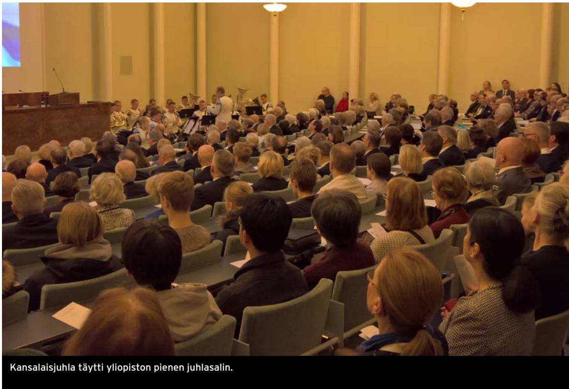
Kansalaisjuhla täytti yliopiston pienen juhlasalin.