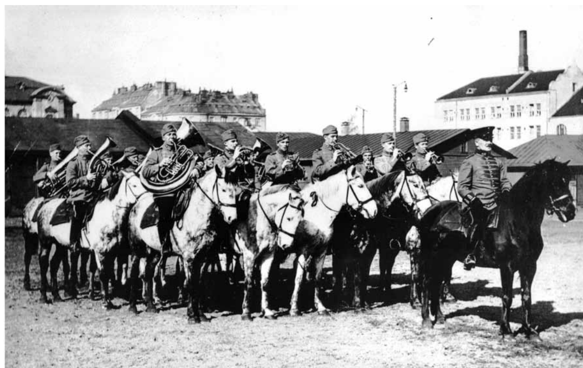
Rakuunasoittokunta ratsain Turun kasarmilla - vuoden 2012 vartioparaatissa soittokunta oli liikkeellä jalan.