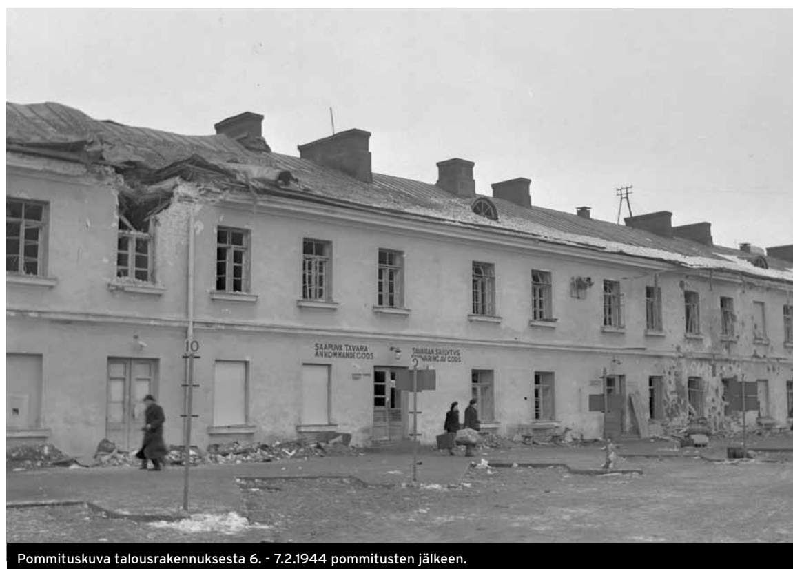
Pommituskuva talousrakennuksesta 6. - 7.2.1944 pommitusten jälkeen.

tieltä. Helsingin kantakaupungin alueen suurimmasta kasarmialueesta jäi jäljelle vain linja-autoasema toiminut talousrakennus. Nykyään Turun kasarmin päärakennuksen kohdalla on Lasipalatsi muualta löytyvät mm. Kampin keskus ja Tenispalatsi.