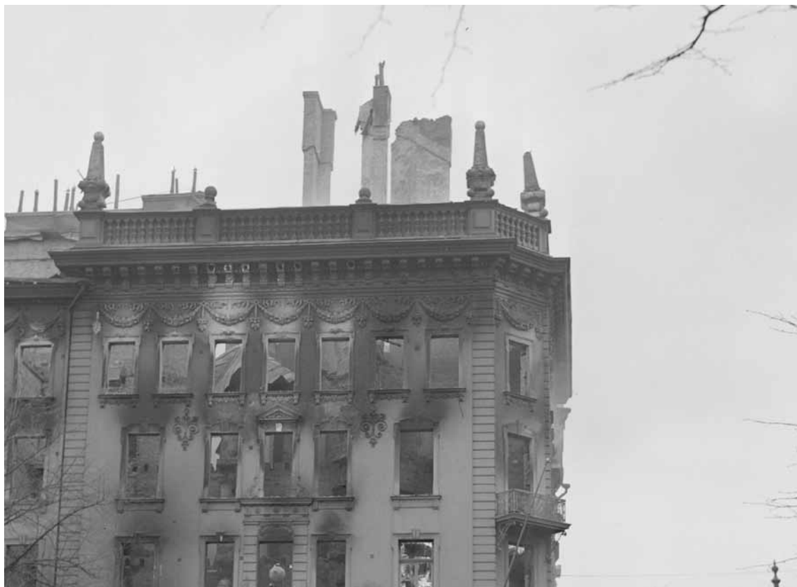
Bulevardi 21 helmikuussa 1944.