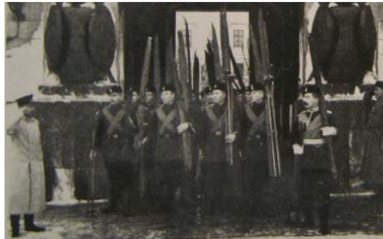
Suomen kaartin tarkk'ampujia marssimassa portista ulos vuonna 1902

Lähteet: Helsingin kaupungin arkisto, Kansallisarkisto, Helsinkiä käsittelevä kirjallisuus ja eräistä kohteista laaditut rakennushistori-