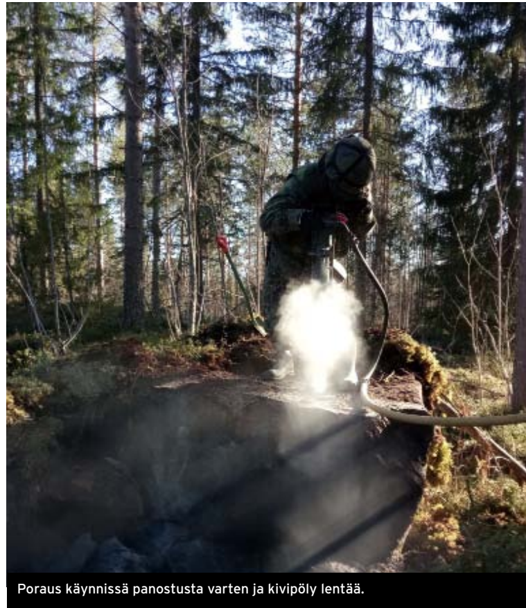
Poraus käynnissä panostusta varten ja kivipöly lentää.

Pioniär- ja paineilmaporakoneiden käyttöä kiven poraamisessa. Puut katkesivat, kivet halkesivat ja kantot nousivat pintaan ihan suunnitelmien mukaan.