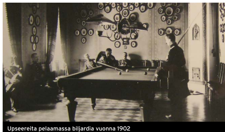
Upseereita pelaamassa biljardia vuonna 1902