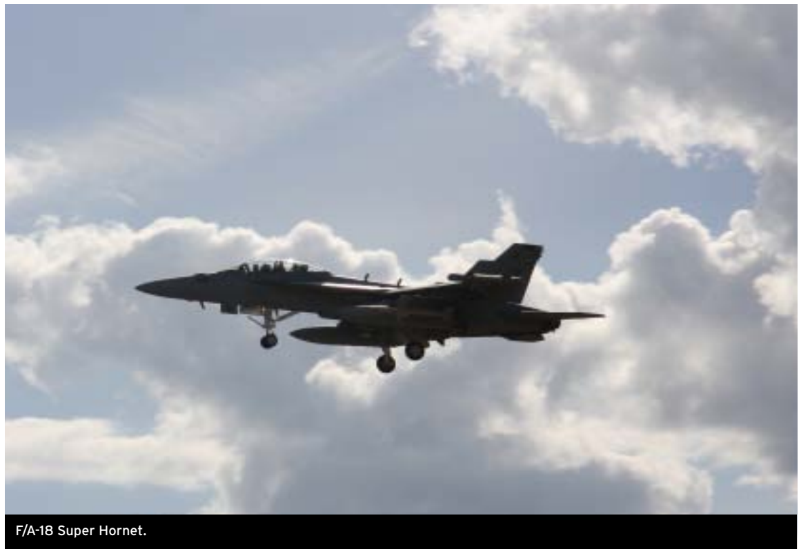
F/A-18 Super Hornet.