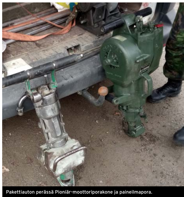
Pakettiauton perässä Pioniär-moottoriporakone ja paineilmapora.