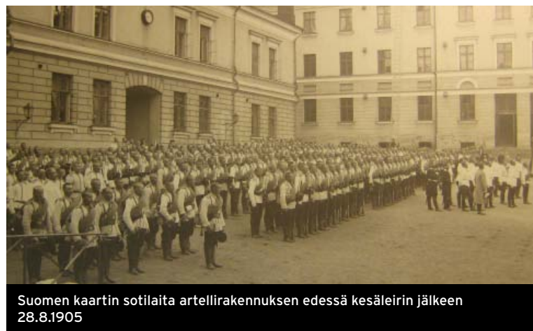
Suomen kaartin sotilaita artellirakennuksen edessä kesäleirin jälkeen 28.8.1905