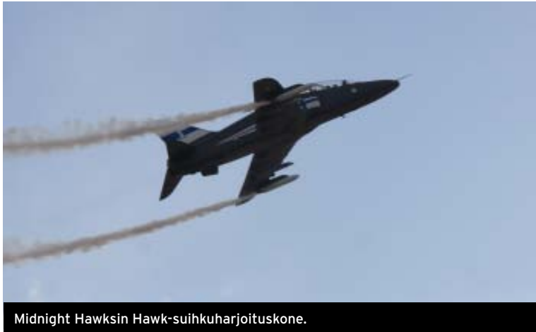
Midnight Hawksin Hawk-suihkuharjoituskone.