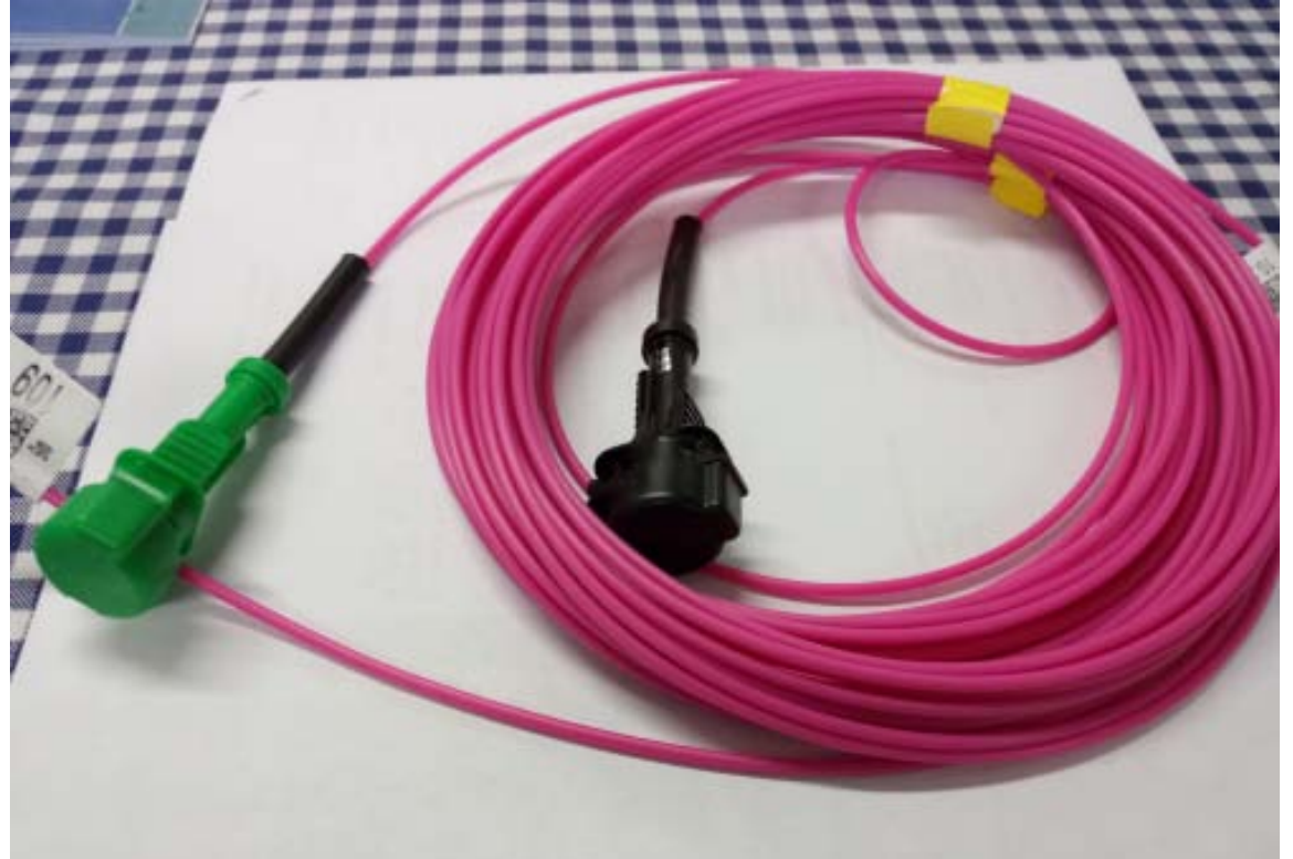
Nippu impulssisyytyslankaa ja kaksi sen liitintä.

Harjoitusräjäytykset tehtiin ryhmissä. Jokaiseen tehtävään laskettiin panokset ja kuitattiin laskelmalla tarvittavat tarvikkeet. Tarjolla oli dynamiittia, aniittia ja räjähtävää tulilankaa. Raivausräjytyksen luonteen mukaan panokset laitettiin mieluummin vähän varman päälle. Ryhmissä päästiin myös kertaamaan