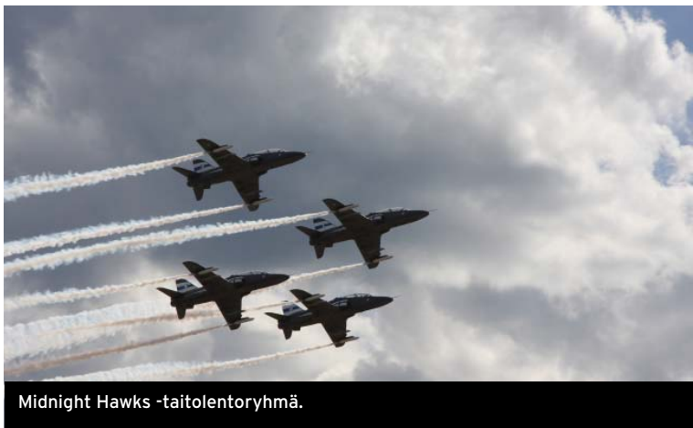
Midnight Hawks -taitolentoryhmä.