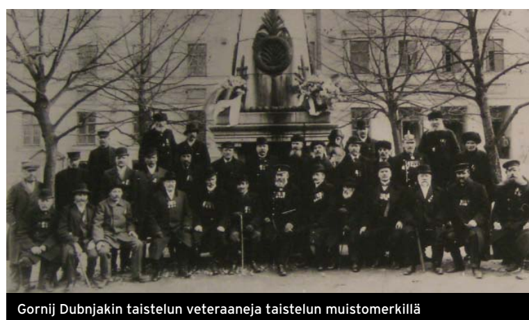
Gornij Dubnjakin taistelun veteraaneja taistelun muistomerkillä