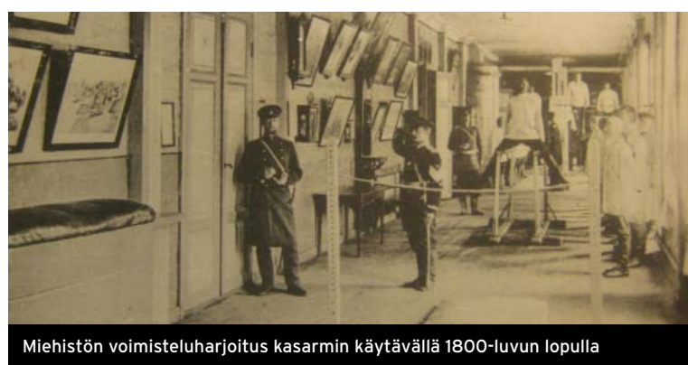
Miehistön voimisteluharjoitus kasarmin käytävällä 1800-luvun lopulla