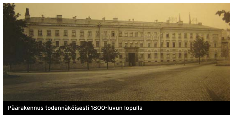
Päärakennus todennäköisesti 1800-luvun lopulla

alliset selvitykset. Kuvat, kartat ja piirustukset: Helsingin kaupungin arkisto, Helsingin kaupungin mu-