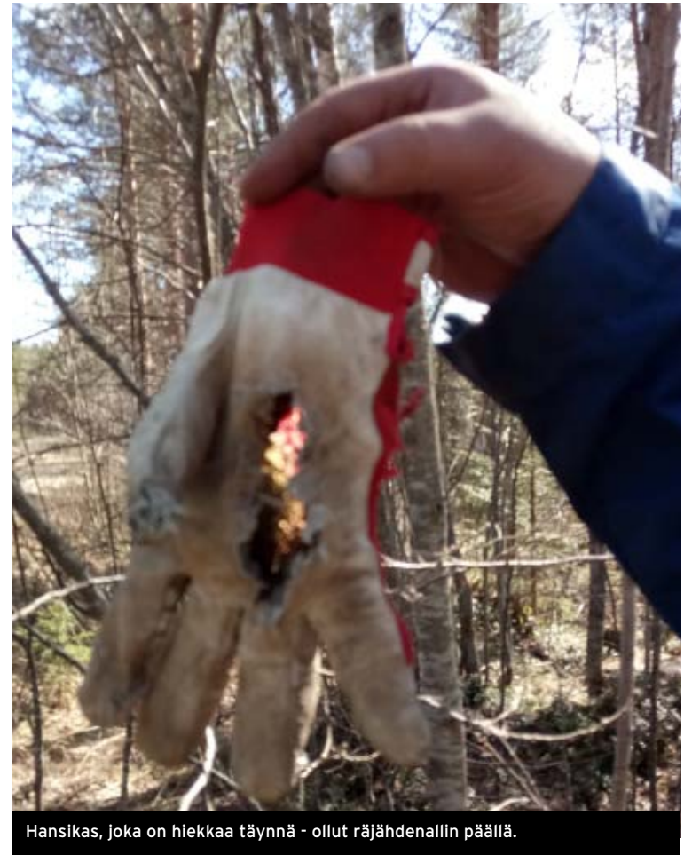
Hansikas, joka on hiekkaa täynnä - ollut räjähdennallin päällä.

Kurssin jälkipuinnissa kuulumme myös, että pioneeriasealajin kurssitusta ollaan nostamassa MPK:n järjestämässä kokonaisuudessa näkyvämmäksi. Siihen haluttiin tukea eri muodoissaan. Jämme mielenkiinnolla odottamaan seuraavaksi suunniteltua teräksen ja betonin räjäyttämisen suunnattua Raivausräjyttäjäkurssi 2:ta.