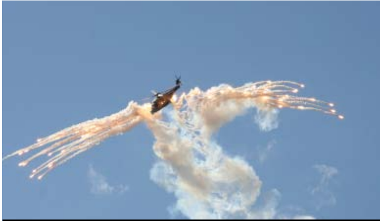
NH-90 ja omasuojaajitteet.

oli Suomen ilmavoimamuseosta tuotu muun muassa Bristol Blenheim, Saab J-35 Draken, MiG-21BIS sekä Messerschmitt Bf-109. Lentävinä museokoneina nähtiin Fokker D.VII. Gloster Gauntlet, Stieglitz ja Viima. Myös MiG-15 oli näytökseen tulossa, mutta joutui perumaan esityksensä teknisen vian takia. MiG-15 palveli Suomen ilmavoimissa vuosina 1962 – 1977, tarkoituksena oli madaltaa kynnystä siirryttäessä Fouga Magister -harjoituskoneista suorituskykyisiin MiG-21-hävittäjiin.