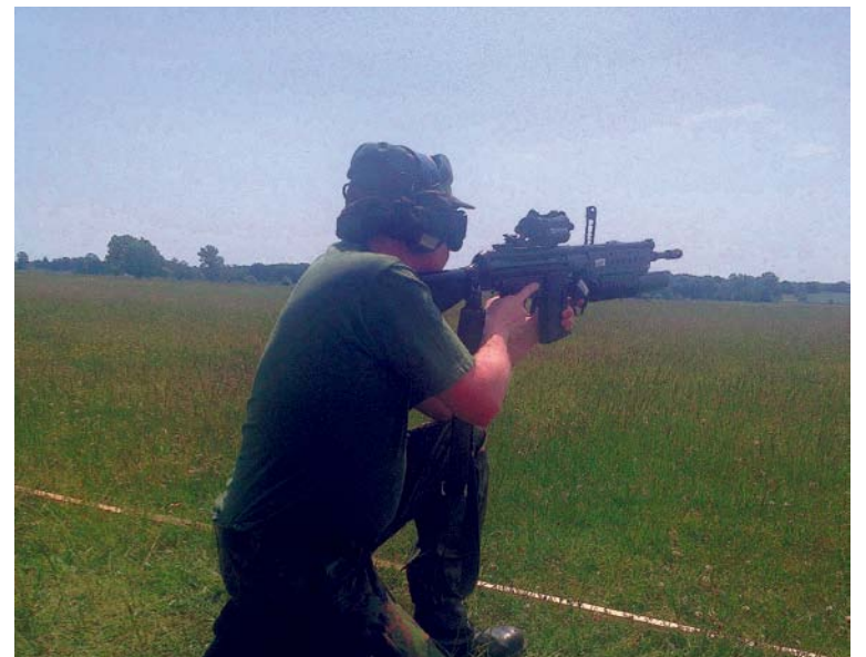
AK4-kivääriammunta, kilpailu järjestettiin Ruotsin Malmössä 13.6.2015.