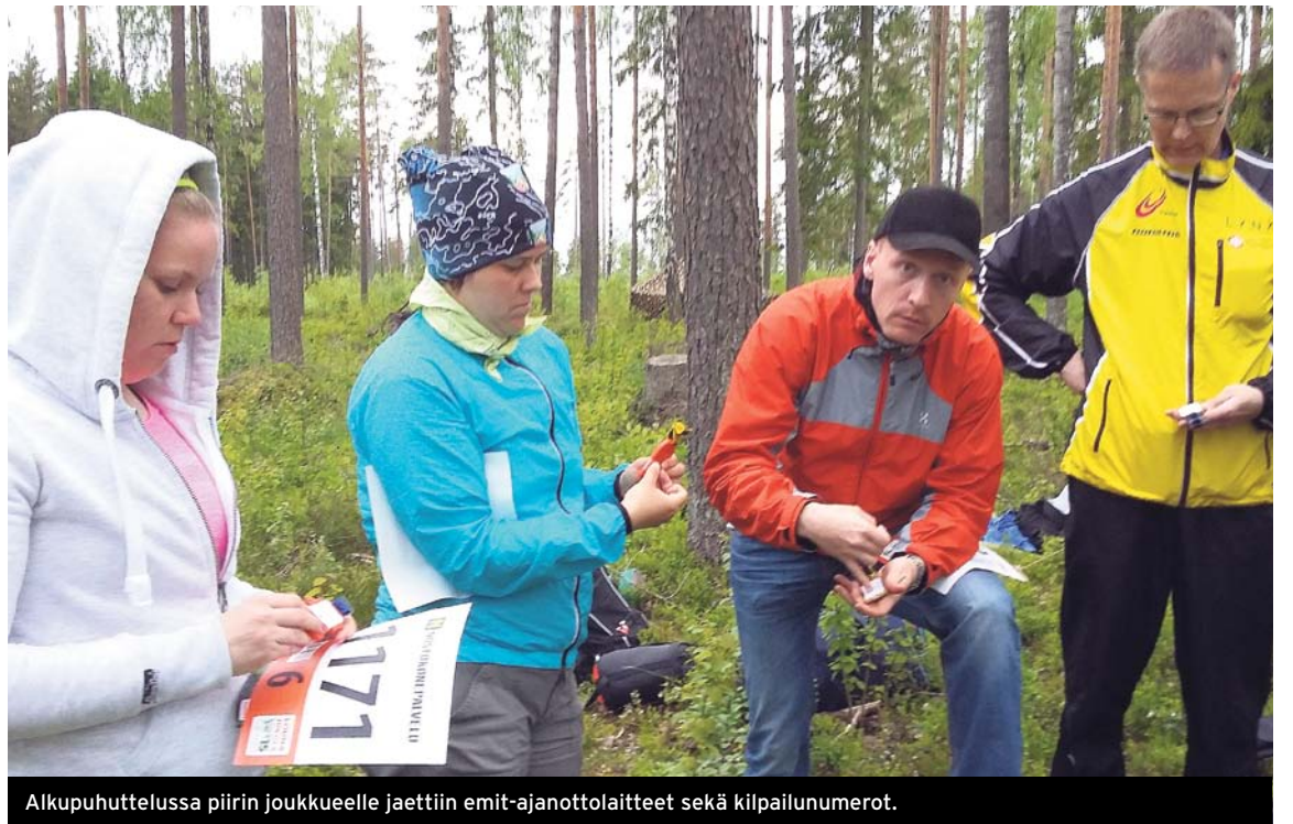
Alkupuhuttelussa piirin joukkueelle jaettiin emit-ajanottolaitteet sekä kilpailunumerot.

Joukkuepaita hankitaan mukaan lähteville.