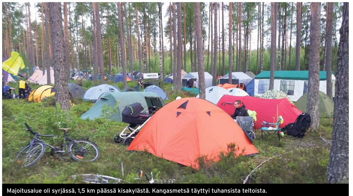
Majoitusalue oli syrjässä, 1,5 km päässä kisakylästä. Kangasmetsä täyttyi tuhansista teltoista.