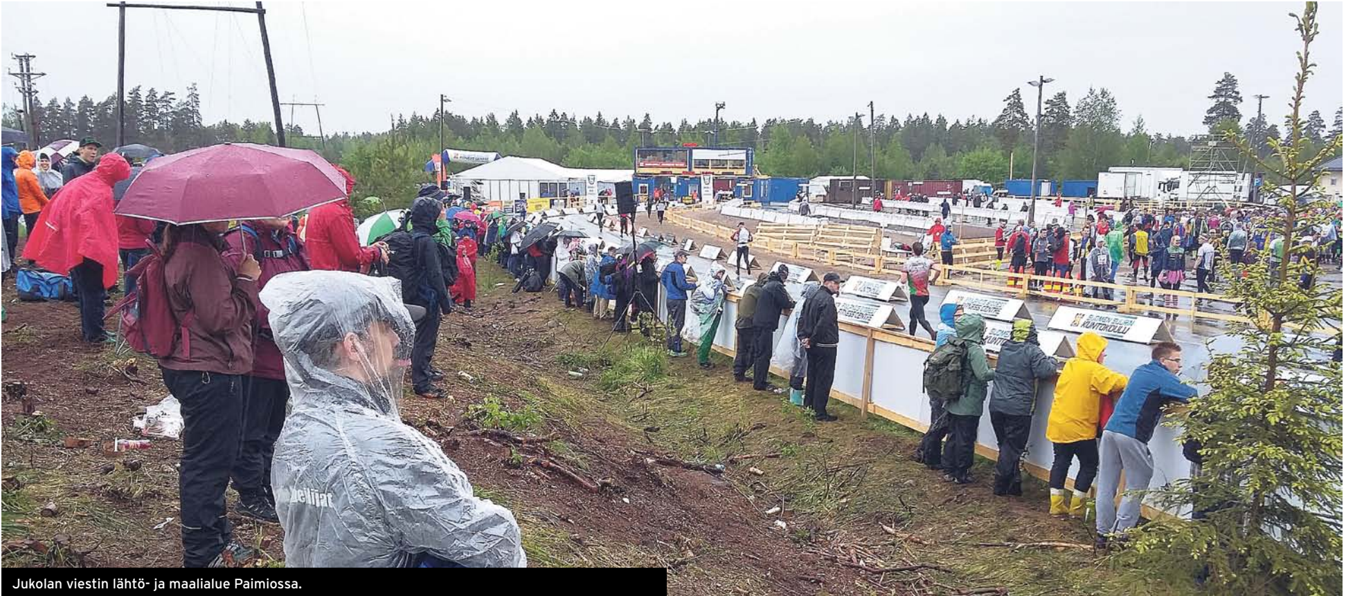
Jukolan viestin lähtö- ja maalialue Paimiossa.