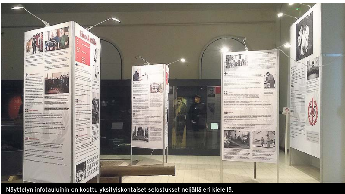
Näyttelyn infotauluihin on koottu yksityiskohtaiset selostukset neljällä eri kielellä.

Sotamuseon Maneesin pysyvä näyttely on Autonomiasta Atalantaan, joka esittelee Suomen sotahistoriaa sekä maamme puolustuslaitoksen vaiheita menneiltä vuosisadoilta nykypäivään. Esillä on mittava kattaus univormuja ja ainutlaatuisia oheismateriaalia sekä raskasta kalustoa vanhoista pronsisitykeistä meritorjuntaohjuksiin. Museovieras voi sovittaa ylleen sotilaan varusteita sekä testata taitoaan punkan petaamisessa. Korkea, noin 1 000 m 2 :n kokoinen halli kaikuu puheensorinasta ja lasten kiljauksista. "Sotaisasta" ympäristöstä huolimatta ilmeet eivät ole vakavia. Keltainen post-it-lappu läiskähtää palauteseinälle: kiitos mielenkiintoisesta näyttelykokemuksesta!